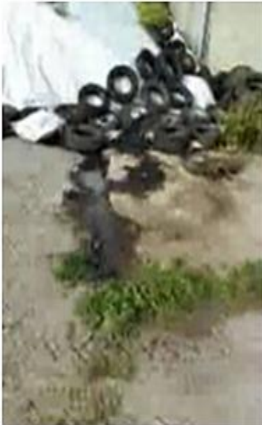
auslaufen von Silosickersaft...