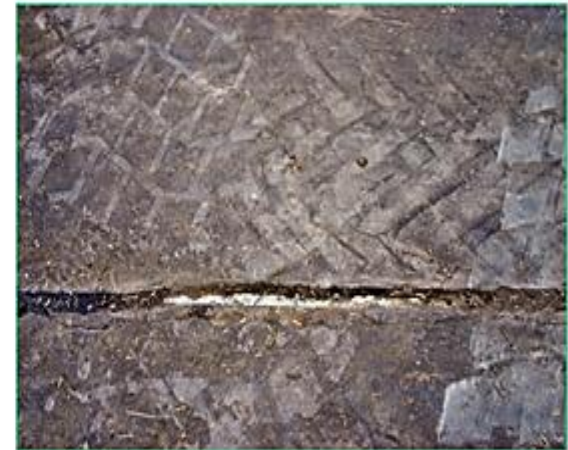
Riss in der Bodenplatte...